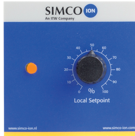
外部控制套件选配