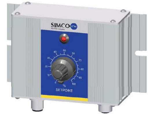
外部控制装置选配